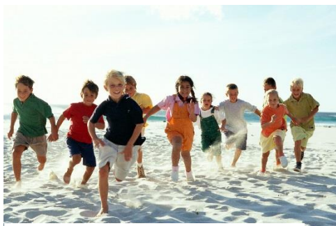
Abbildung 2: http://www.vitakid.de

vitakid bietet eine Plattform an, die Wissen, Kommunikation und Lernen in den Familien, Kitas und Schulen fördert und nutzt dafür konsequent Möglichkeiten der mobilen Kommunikation und stellt eine nachhaltige Vernetzung zwischen Familie und Einrichtungen her. vitakid unterstützt Familien Kitas und Schulen bei der Gesundheitsförderung und Familien bei allgemeinen Fragestellungen bis hin zu ganz persönlichen ernährungswissenschaftlichen Beratungen. 1