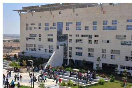
Abbildung 3: Radi Hadad, GJU

Bitte sprechen Sie uns an, wenn Sie weitere Fragen zur GJU oder geplanten Projekten haben.