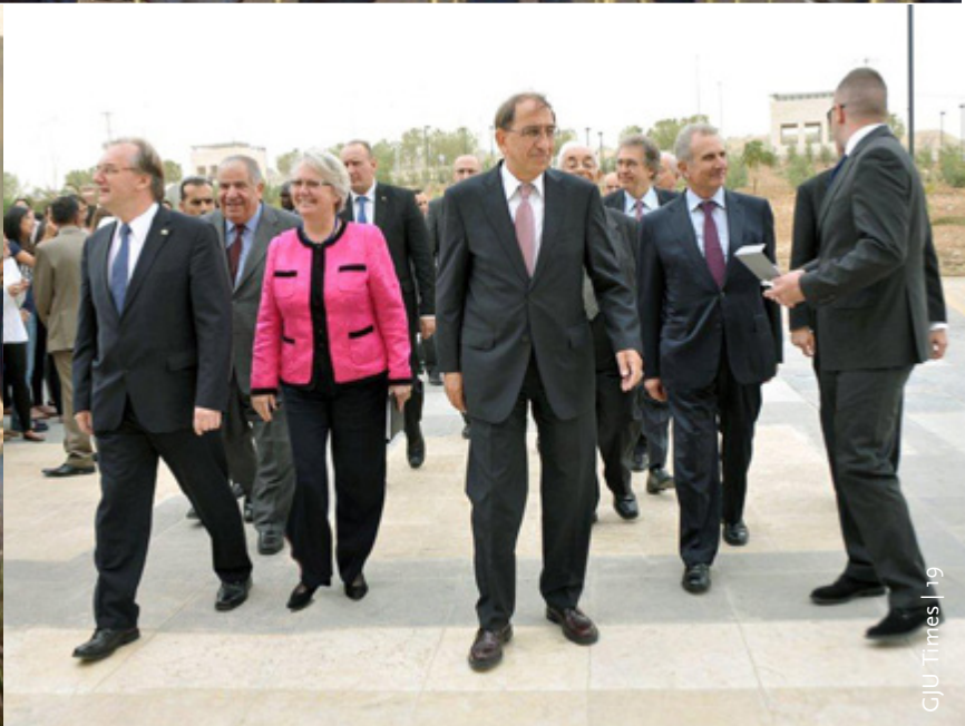
GJU Opening Ceremony