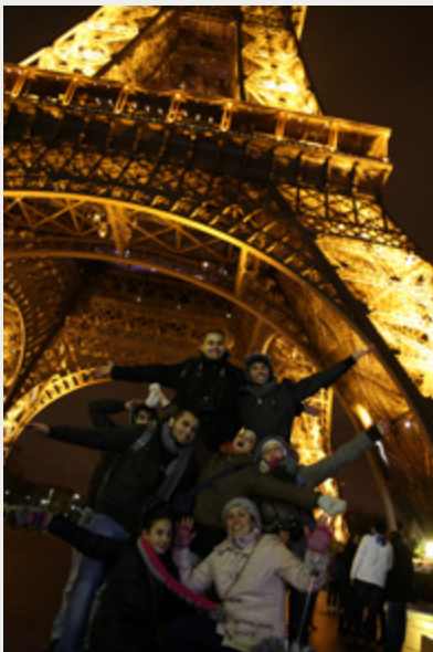
Haya G: New Year in Paris