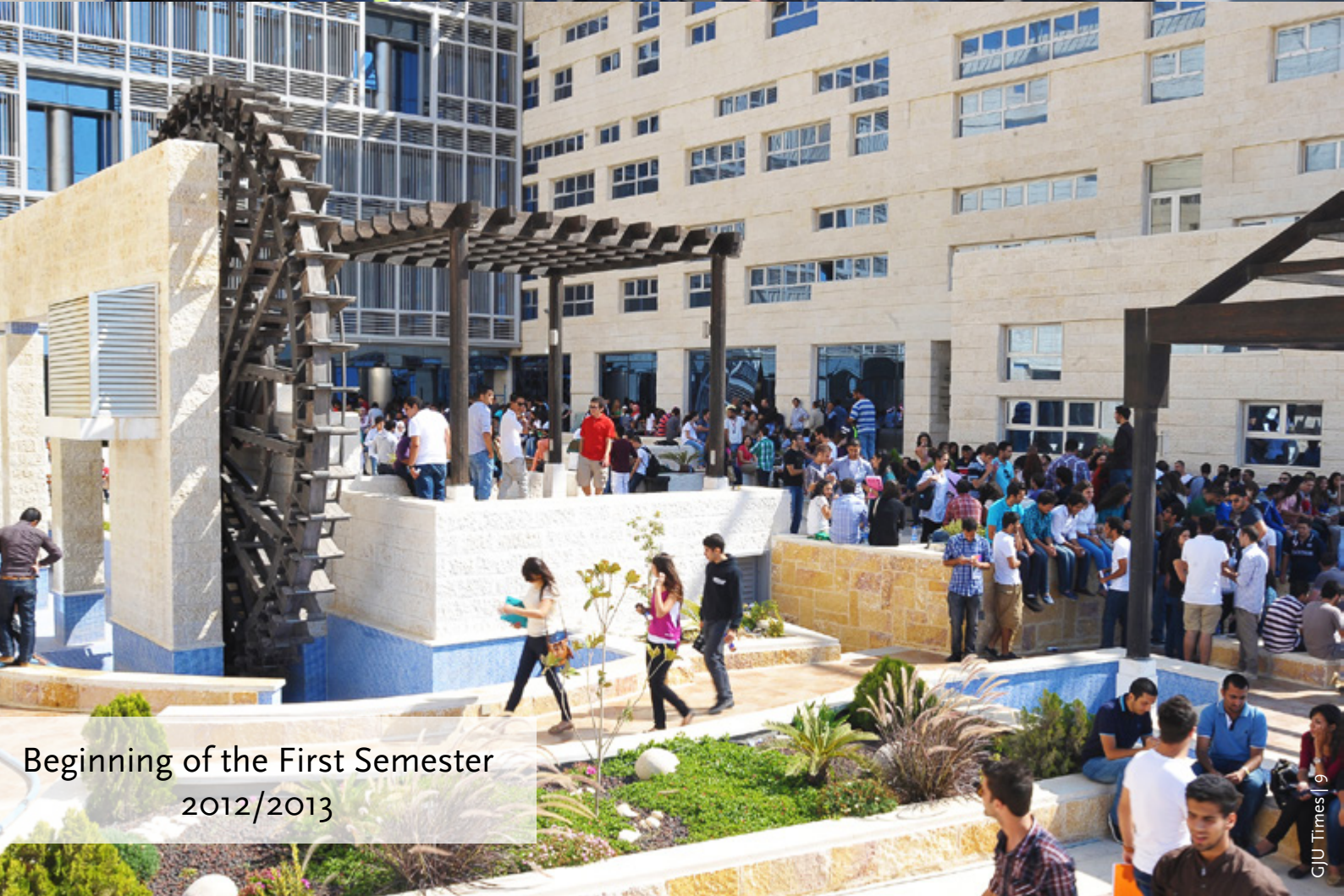
Beginning of the First Semester 2012/2013