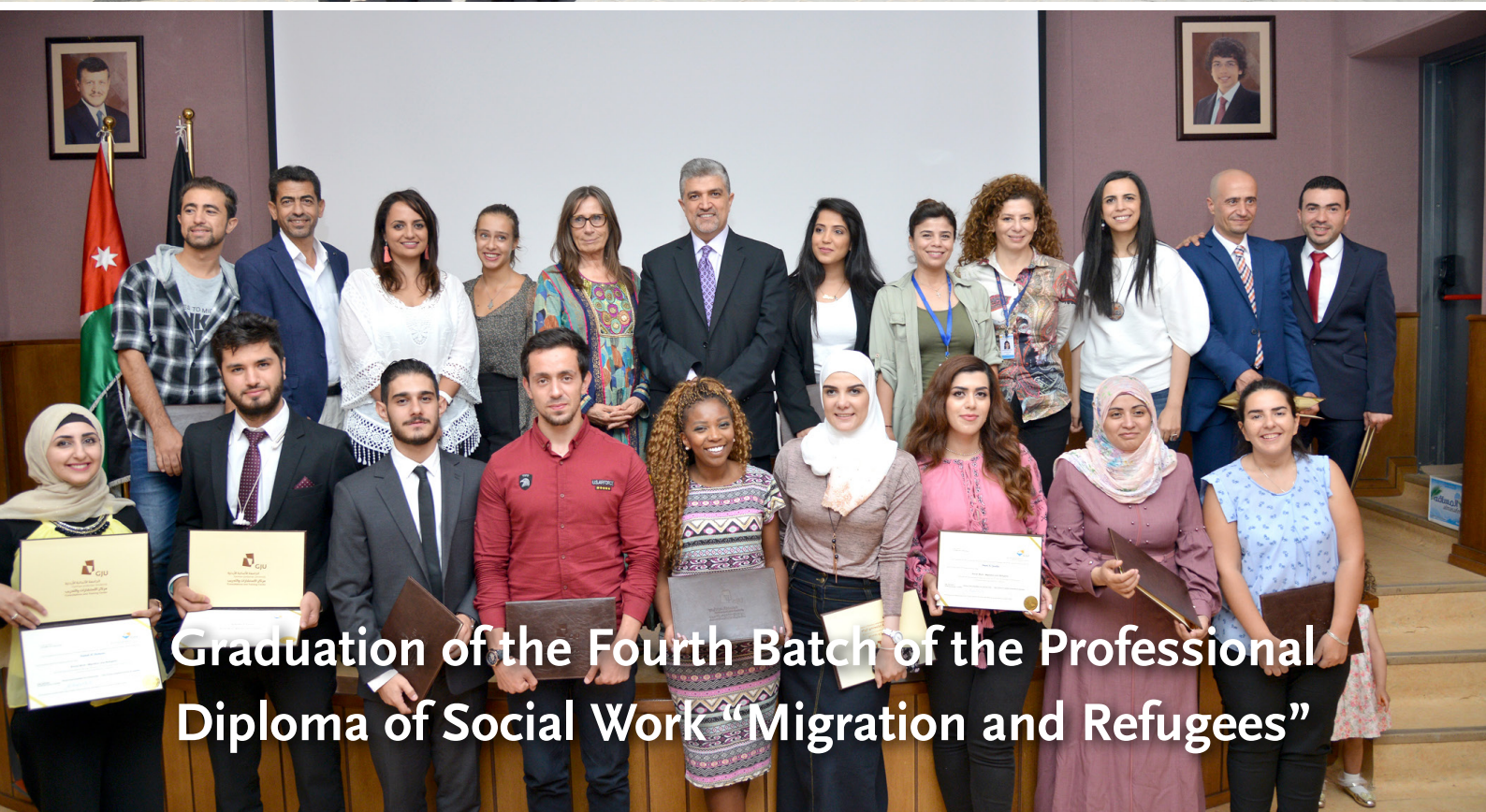
Graduation of the Fourth Batch of the Professional Diploma of Social Work "Migration and Refugees"