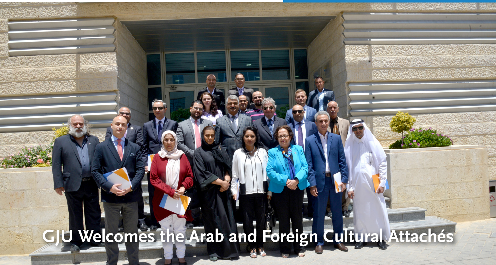
GJU Welcomes the Arab and Foreign Cultural Attachés

الجامعة الألمانية الأردنية German Jordanian University